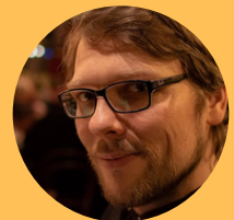
Sean Sams Postproduktion