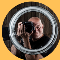
Thorsten Güttes DOP - Kamera