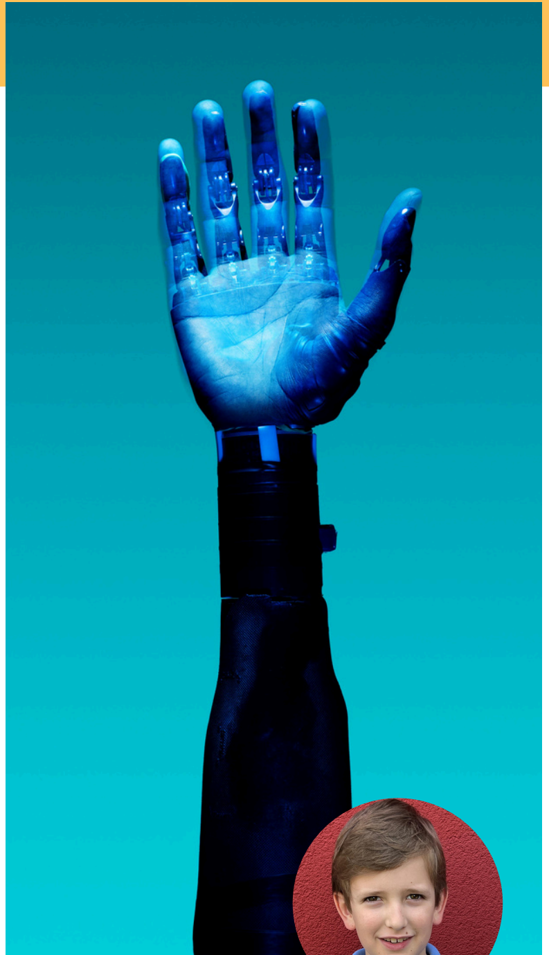
Tom als künstliche Intelligenz

Die Geschichte des Films beschreibt das Leben eines Mannes am Ende seines Weges. Er lebt in einer anonymisierten Welt in der die digitale Technik sehr stark fortgeschritten ist. Gemachte Fehler, Erinnerungen und Schicksale seines Lebens führen ihn in die Einsamkeit. Auf der Suche nach einer Lösung begegnet er Tom, der künstlichen Intelligenz, die er für Gespräche bucht. Tom konfrontiert Carl mit seiner Geschichte und führt ihn zu Sinnesfragen, die Carls Leben auf den Kopf stellen. Es ist der Startschuss einer bewegten Geschichte, die mitreißt und aufzeigt dass es mehr gibt hinter der modernen Fassade einer futuristisch perfekt geplanten Welt.